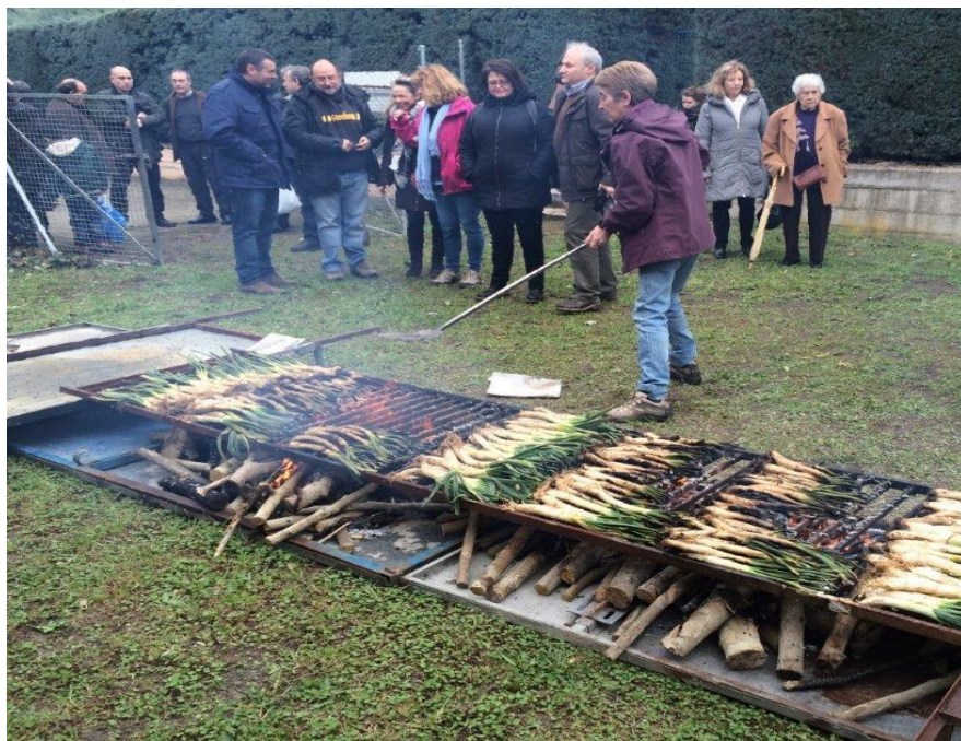
Calçotada con sidra en la Quinta Asturias, organizada por el Círculo Catalán de Madrid y el Centro Asturiano de Madrid