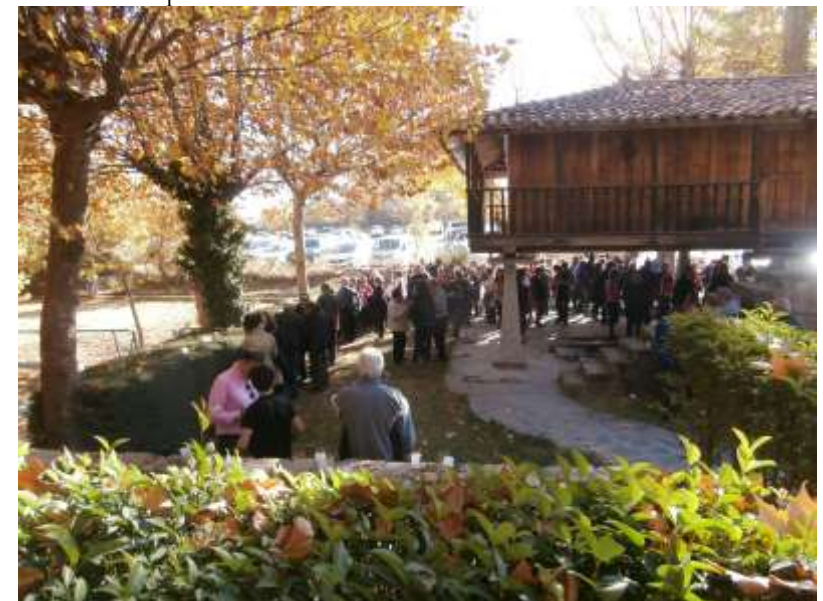
Magüesto en la Quinta Asturias .