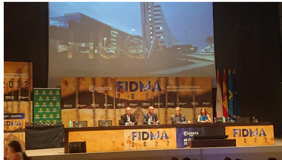
Acto de entrega del título de “Entidad Asturiana del año” al HUCA