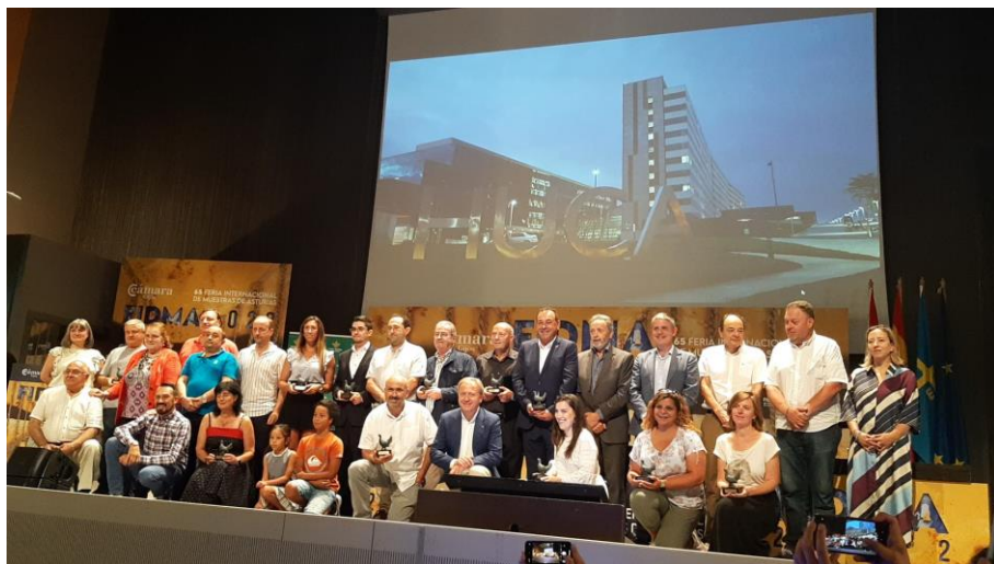
En la imagen los premiados en la presente edición

Martes 9, a las 19,30 h, en la FIDMA de Gijón. Entrega de los Urogallos 2021 a los galardonados en la presente edición.