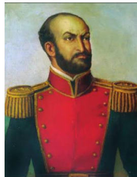
“José Tomás Boves, “el León de los Llanos”. Retrato en el Museo de San Mateo. Aragua. Venezuela”.

Fiel soldado de la causa realista, aunque díscolo y rebelde, José Tomás Boves, el “León de los Llanos” como se le conoce, es también un claro exponente de la crudelísima “Guerra a muerte” proclamada por Bolívar, que tanta sangre injusta e innecesaria hizo correr en América, en lo que no fue sino una verdadera guerra civil entre españoles. Está enterrado en la iglesia de San Jacinto, en la ciudad de Urica en la que encontró la muerte.