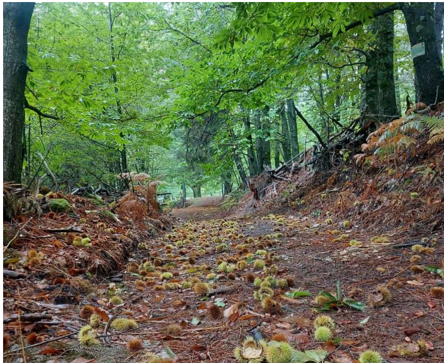
Otoño, tiempo de castañas y magiestos