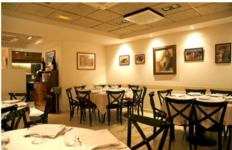
Casa Hortensia – Restaurante ESPECIALIZADO EN COMIDA ASTURIANA C/ Farmacia, 2 Plantas 2ª y 3ª (28004 Madrid) Telfs : +34 915 390 090 – 91 522 42 18 – 91 531 37 24 E-mail: restaurante@casahortensia.com http://www.casahortensia.com