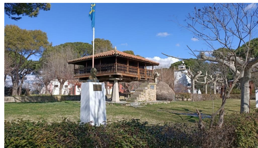
Disfruta con tu familia y amigos de la Quinta "Asturias"