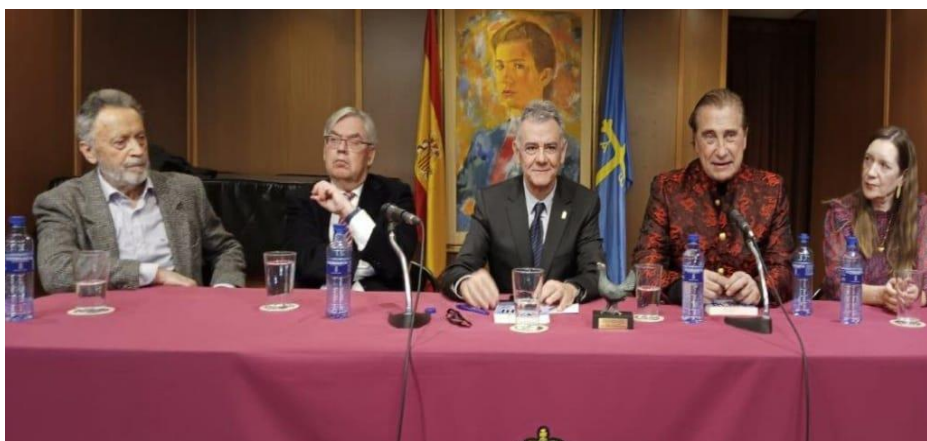
Entrega del Urogallo Especial con Mención Honorífica a la Fundación "Philippe Cousteau" (En la Revista de abril se publicará información sobre este acto)