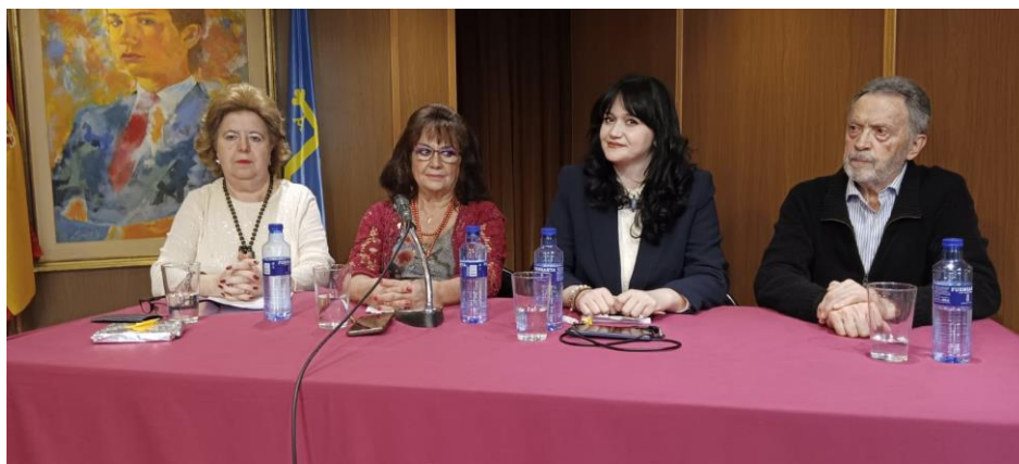
Martes de la Poesía. Mesa de ponentes.