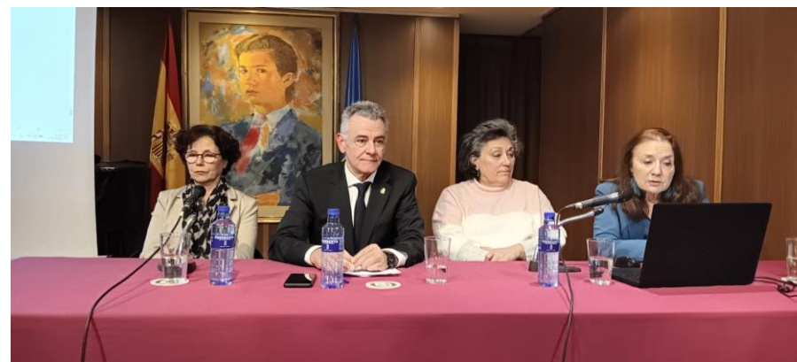
Un momento de la conferencia sobre Ana Ozores (La Regenta)