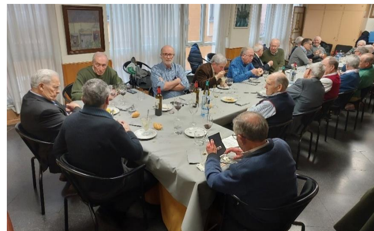
Comida del felechu

Sábado 13. Comida de convivencia de las Peñas Felechu y Felechinas