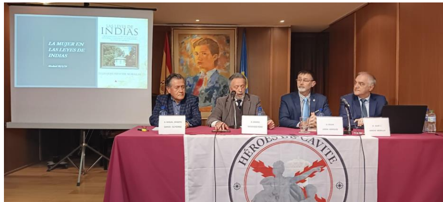
Mesa de ponentes

Primera ponencia: Los reyes españoles desde el mismo momento del descubrimiento del continente de América se esmeraron en dotar a los pueblos nativos de una protección absoluta y no dudaron en aplicar con rigor las leyes a los colonizadores europeos que las desataron o practicaron abusos contra los indígenas. La ponencia trató sobre el ordenamiento de protección de la monarquía hispana a los pobladores nativos en América centrandolo su ponencia de manera especial en las mujeres indias.