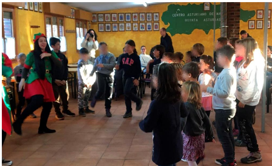
Los niños juegan con los animadores

Domingo 7. Fiesta infantil de Reyes. Animación con el Grupo “Saltimbanki”. Regalos para todos los niños.