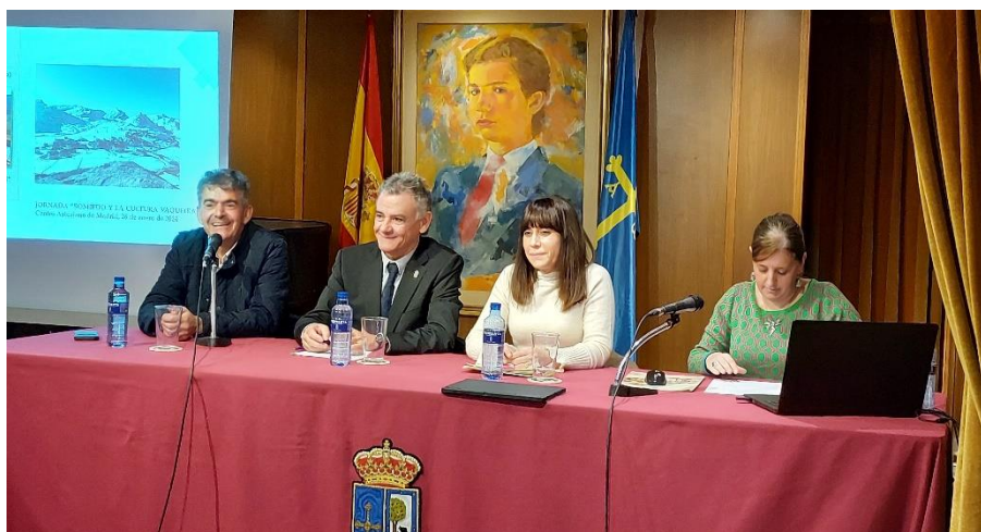
Mesa de ponentes de la Jornada de Somiedo