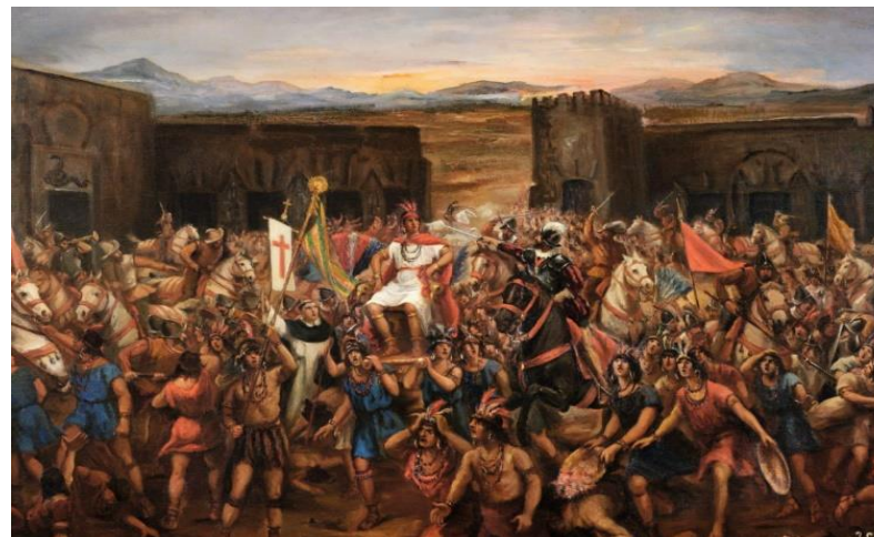
"La batalla de Cajamarca. Captura del Inca Atahualpa. Por Juan Lepiani

Que hagan Vds. mucho bien y que no reciban menos