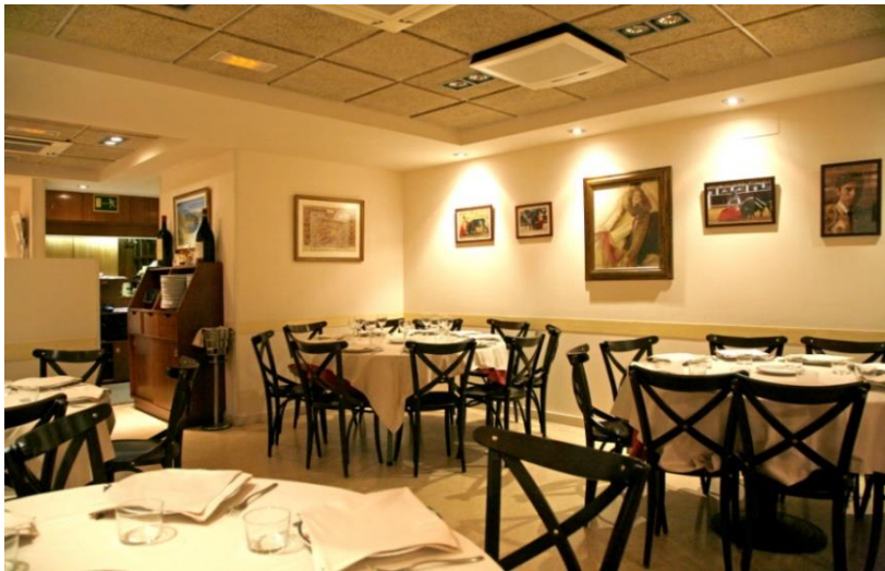
Casa Hortensia – Restaurante ESPECIALIZADO EN COMIDA ASTURIANA C/ Farmacia, 2 Plantas 2ª y 3ª (28004 Madrid) Telfs : +34 915 390 090 – 91 522 42 18 – 91 531 37 24 E-mail: restaurante@casahortensia.com http://www.casahortensia.com