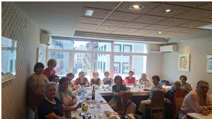
La Peña Las Felechinas durante su almuerzo mensual

Quizá los festejos del Santo Patrón ofrecen una magnífica oportunidad para conocer el Madrid más castizo pues, entre los comensales del Felechu surgieron comentarios con la vista puesta en las futuras fiestas de San Isidro y su celebración en el lugar castizo, que es la pradera, a la que ponen colorido chulapos y chulapas , animados por la música ambiente